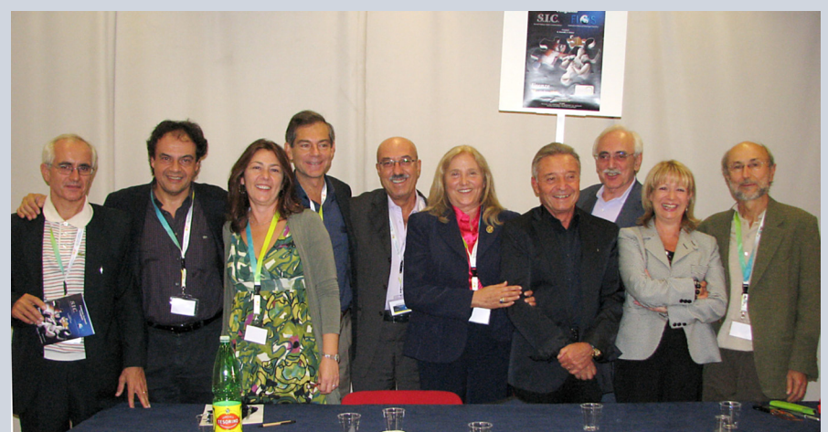
Consiglio direttivo della FISS*